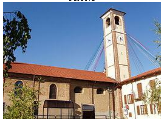
VAUDA C. SE